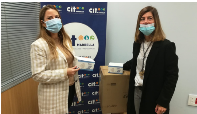
Entrega donación mascarillas para donar a ONGs y Fundaciones