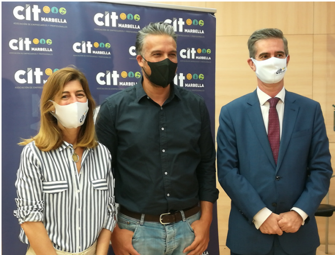
Presentación nueva web CIT