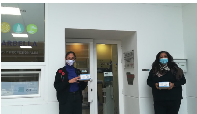
Entrega donación material sanitario a Fundación Andrés Olivares