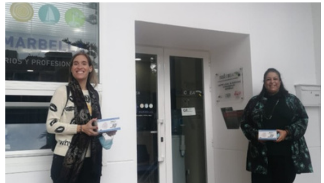
Entrega donación material sanitario a Fundación Cesare Scariolo