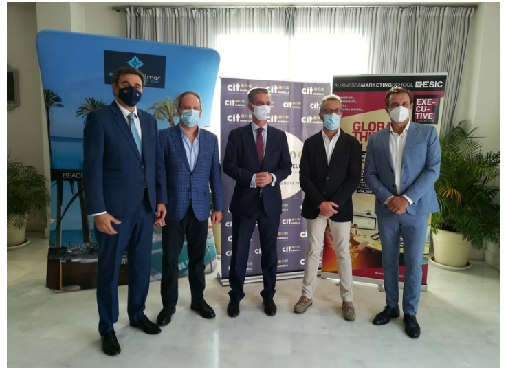
Encuentro líderes empresariales