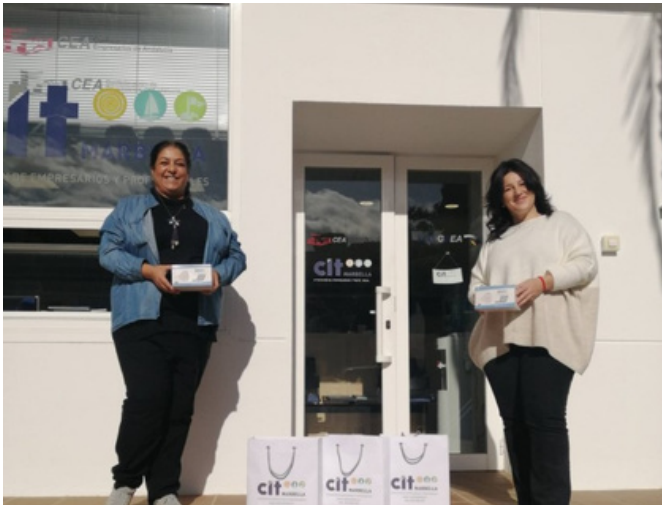
Entrega donación material sanitario a Cudeca