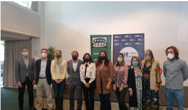
Desayunos que inspiran