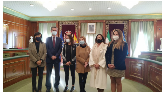
RSC Entrega cheque juguetes