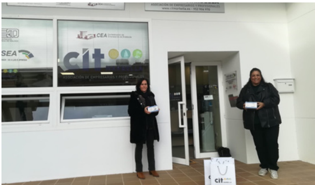
Entrega donación material sanitario a Casa Ronald Mc'Donalds