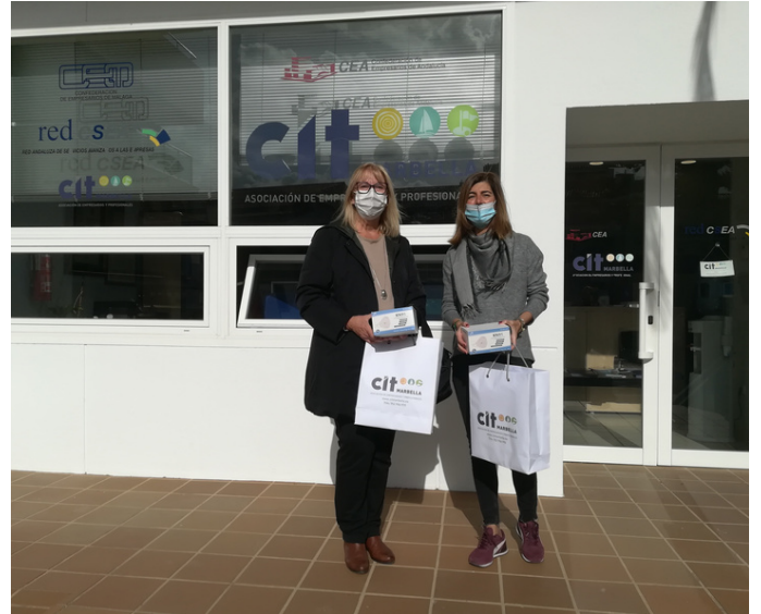
Entrega donación material sanitario a Fundación Corinto